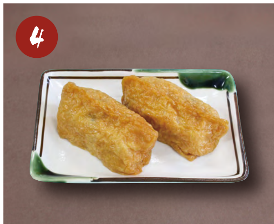
4 いなりすし 250円