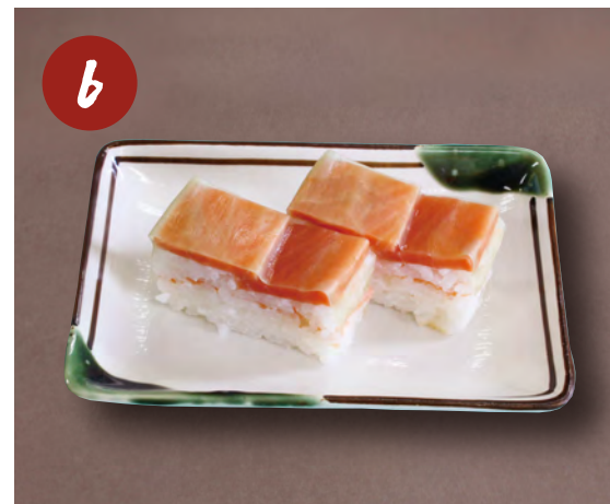
6 べにとろすし 310円