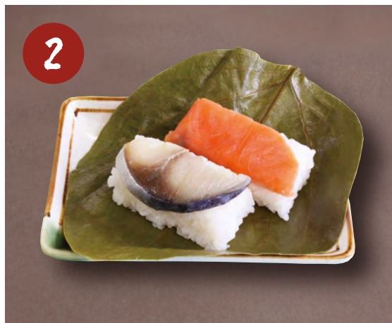
2 柿の葉すし (さば・さけ) 370円