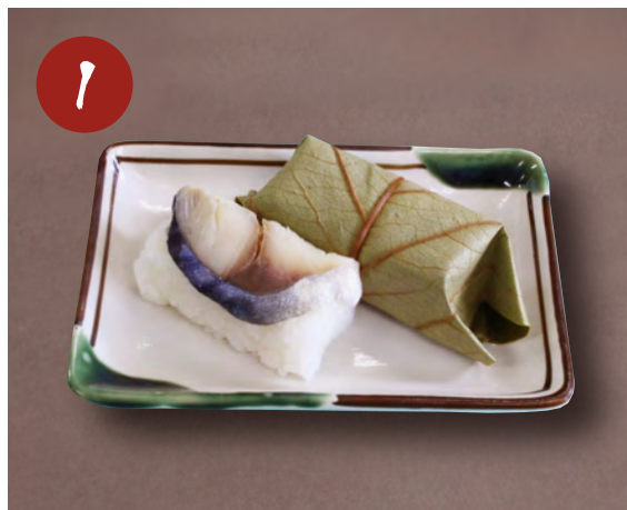
1 柿の葉すし (さば) 330円